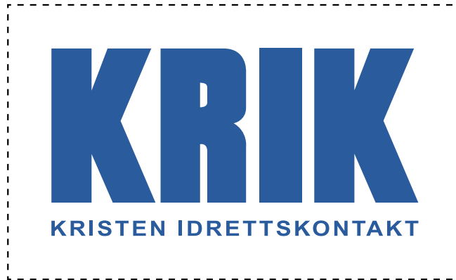
KRIK-logo med minimum clear space.