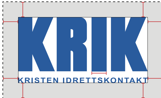
I'en er fin å bruke som referanse til clear space.